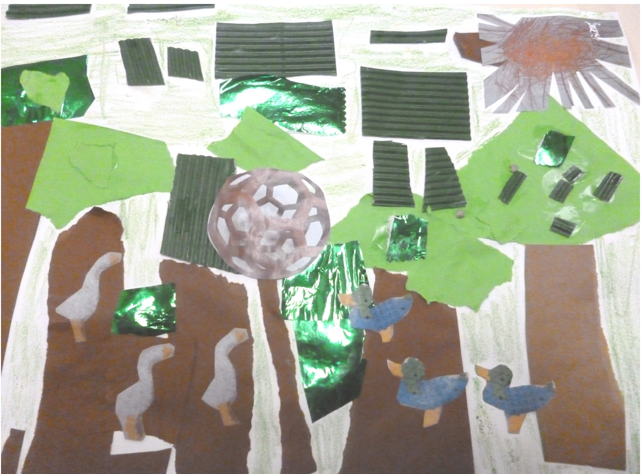
Il fait soleil, dehors les enfants s'amuse ensemble au ballon.