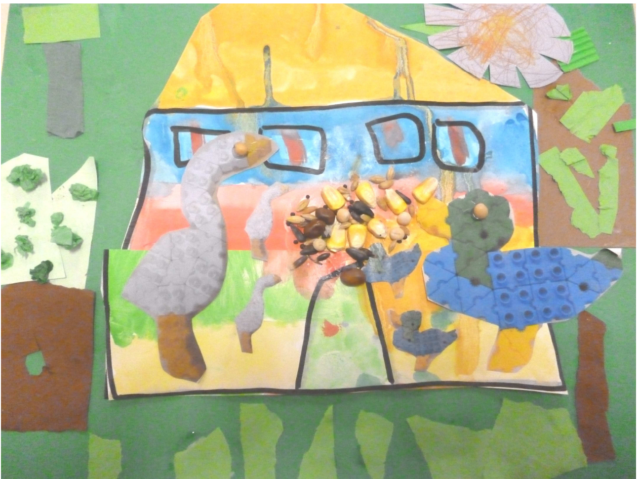
Dans une maison au bord de la forêt, famille canard mange des graines avec famille oie.